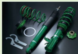
写真はHONDA フィット用

シールド構造プラットフォームを採用し、圧倒的な低価格と合わせて安定した高品質によってアフターマーケット向けのサスペンションキットとしては異例とも言える長期製品保証を実現。シンプルな構造でビギナーにも扱いやすい特徴を持つねじ式車高調整機構を採用。もちろんADVANCEニードルを使用しEDFCシリーズにも対応したことで様々なセッティングを楽しむことも可能。